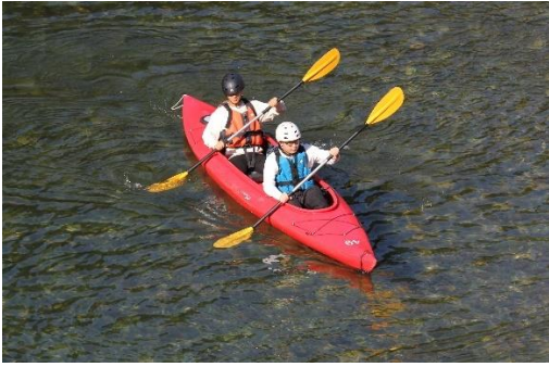
綺麗な川をスイスイ下ります。