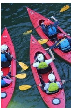
カヌー同士も激突！