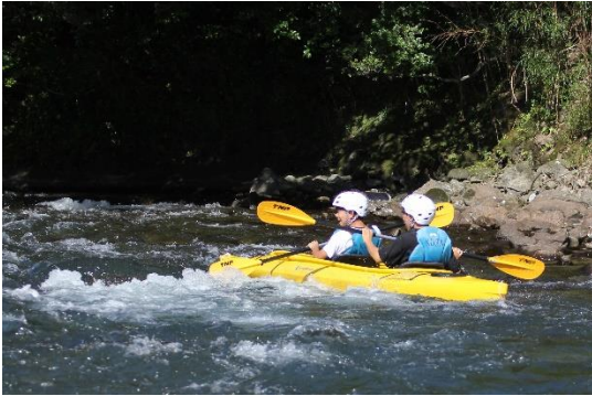
前後がひっくり返ってしまいました。そのまま流れに身を任せて下って行きました。