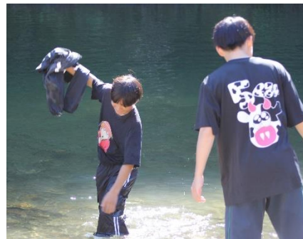
お約束の水遊びです。