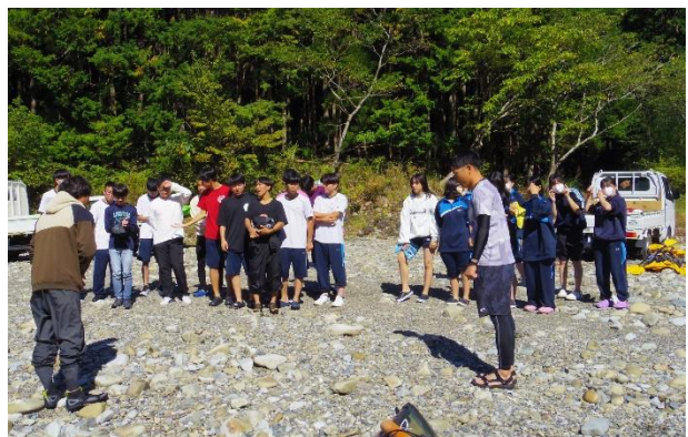
最後にインストラクターさんにお礼をしました。