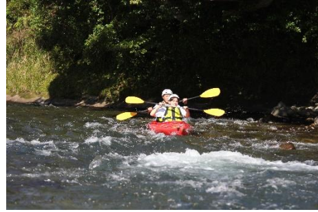
一番の難所を下ります。