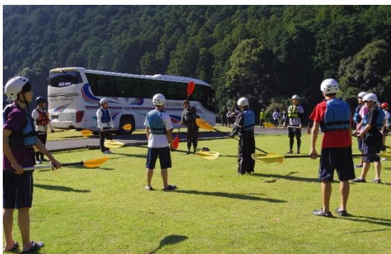
パドルの操作をレクチャーしてもらいます。