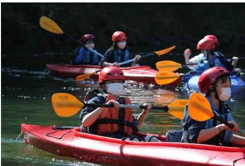
ゴール地点に到着しました。