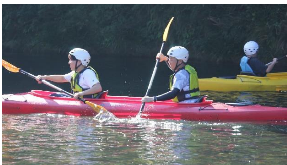
カヌーの操作を練習します。