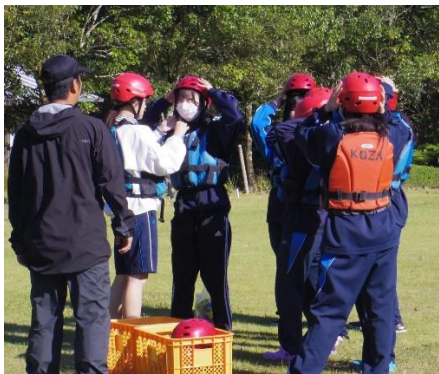
まずはライフジャケット、ヘルメットを着用して、パドルを準備