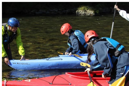
いよいよカヌーに乗り込みます。