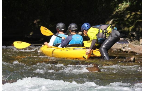
岸に引っ掛かり動けませーん。インストラクターさんに救助してもらいました。