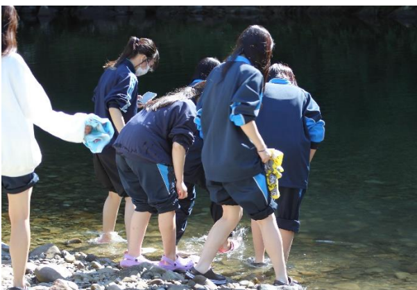
足をきれいに洗います。