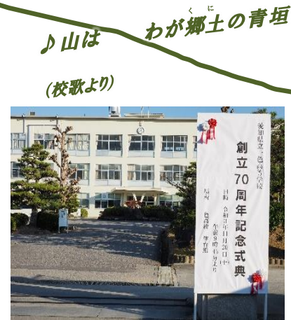
♪山はわが郷土の青垣 (校歌より)