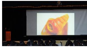
生活デザイン科発シーフード カレーパン