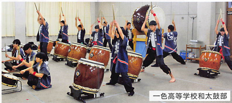
一色高等学校和太鼓部